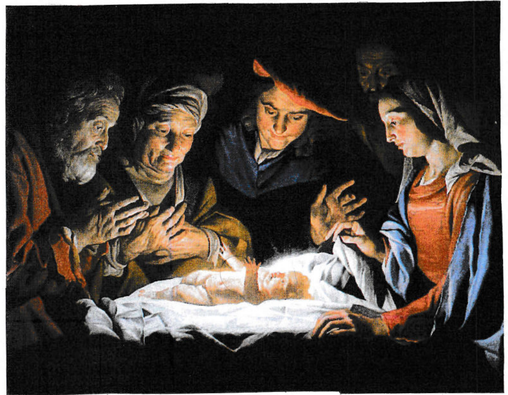
(Maleri af Mathias Stomer, 1632)