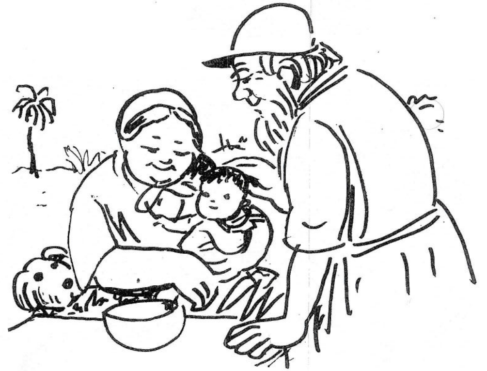
Illustration fra „Abraham, Isak og Jakob“.